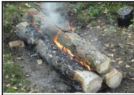
б - _____