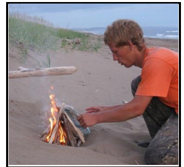
в - _____

26. Какие формы костров применяют в туристских походах?