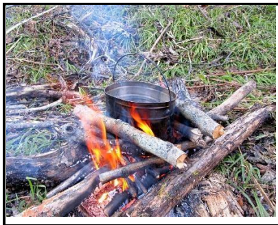
а - _____

25. Какие формы костра запечатлены на фотографиях?